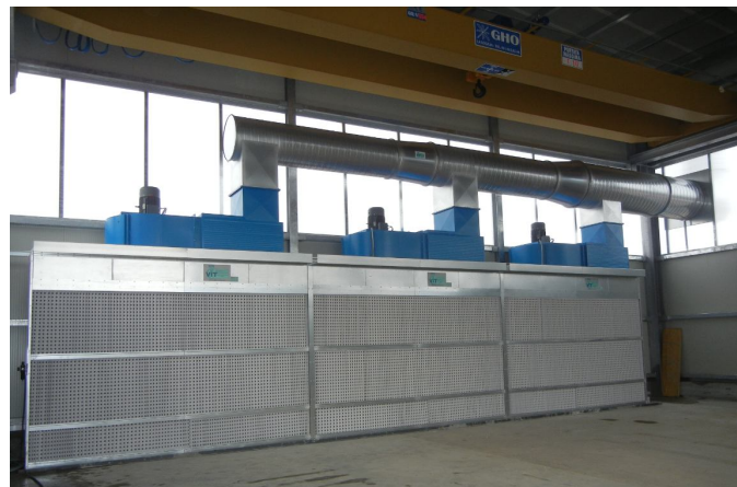
n.3 Top Dry in serie per soluzioni personalizzate