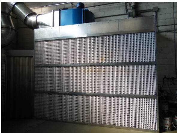
Top Dry Plus per altezze fino a 3,5 metri